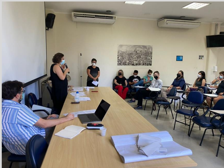
164ª Reunião Ordinária (28/04)