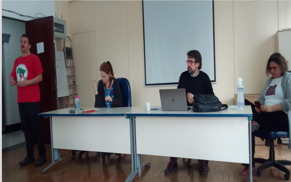
169ª Reunião (29/09)