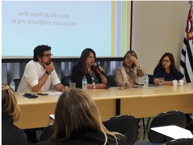
135ª Reunião Ordinária - Cigarro Eletrônico