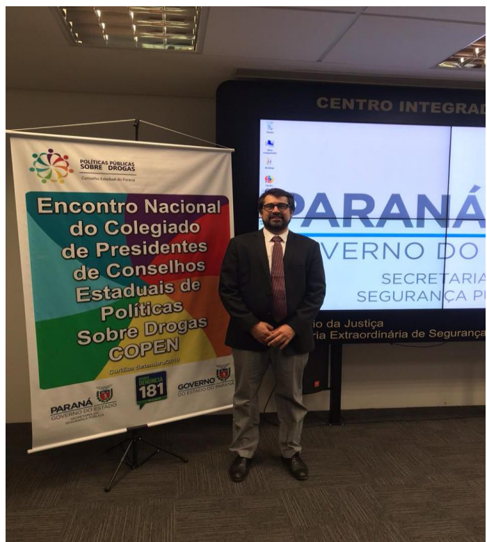
Encontro de Presidentes Estaduais de Conselhos sobre Drogas - Curitiba e São Paulo