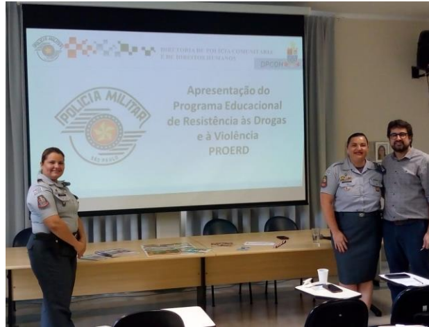
136ª Reunião Ordinária – PROERD