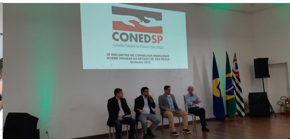
Encontro de COMADs Botucatu