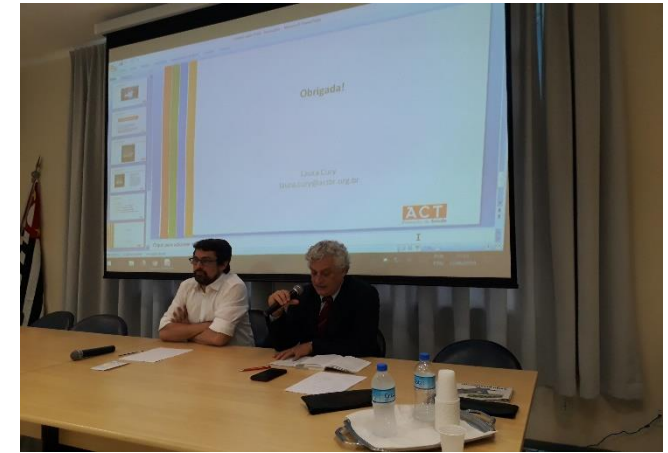
131ª Reunião Ordinária Oscar Vilhena