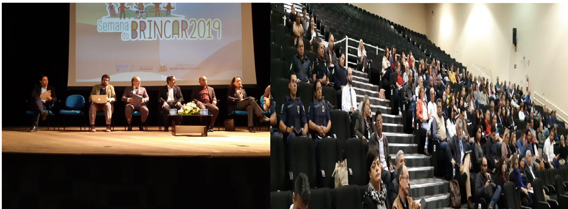
Encontro de Conselhos Municipais – Mogi das Cruzes