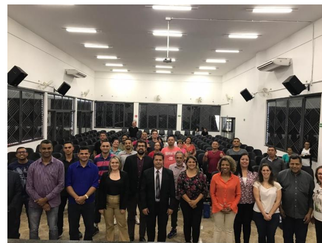
Encontro em Santa Isabel