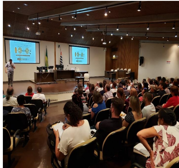
Palestra no CRAVI